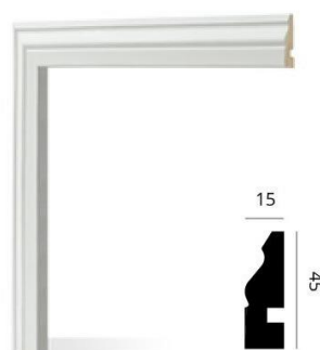
Código: 3001 45 x 15 mm x 2,5 m Blanco mate