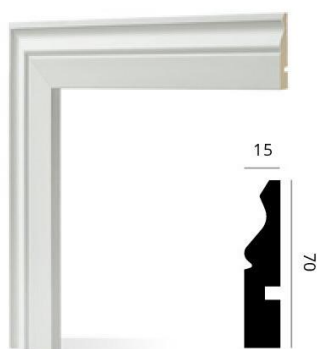
Código: 3000 70 x 15 mm x 2,5 m Blanco mate