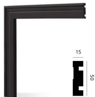
Código: 3003 50 x 15 mm x 2,5 m Negro mate