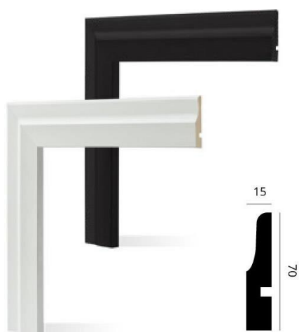
Código: 3005 70 x 15 mm x 2,5 m Blanco mate