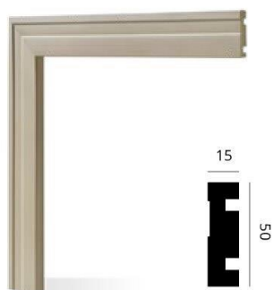
Código: 3004 50 x 15 mm x 2,5 m Visón mate