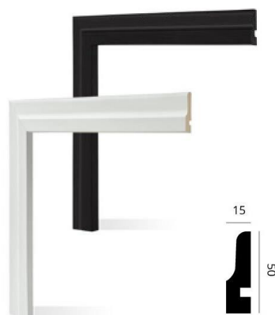
Código: 3007 50 x 15 mm x 2,5 m Blanco mate